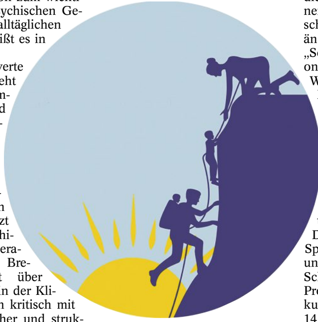
„Gemeinsam über den Berg“: Die Familie ist Themenschwerpunkt der bundesweiten „Woche der seelischen Gesundheit“. Logo: Aktionsbündnis