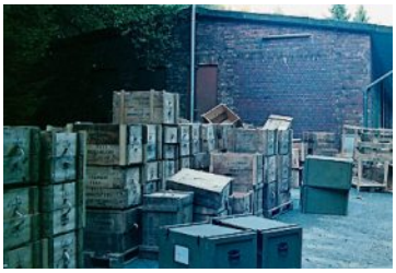
Der Bremer Zivilschutz räumt die Hallen im Hinzeln.