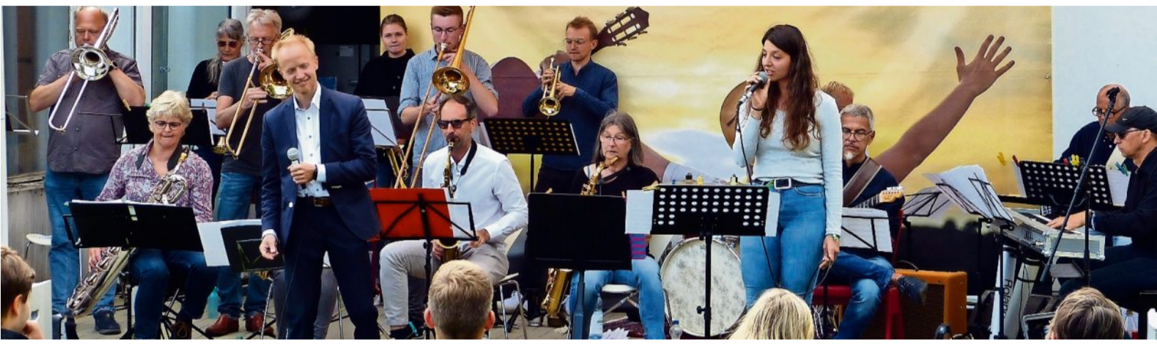
Das gelungene Konzert von „Fettes Blech“ zum Auftakt des Bremervörder Kultursommers macht Appetit auf die folgenden Veranstaltungen. Noch gibt es Karten.