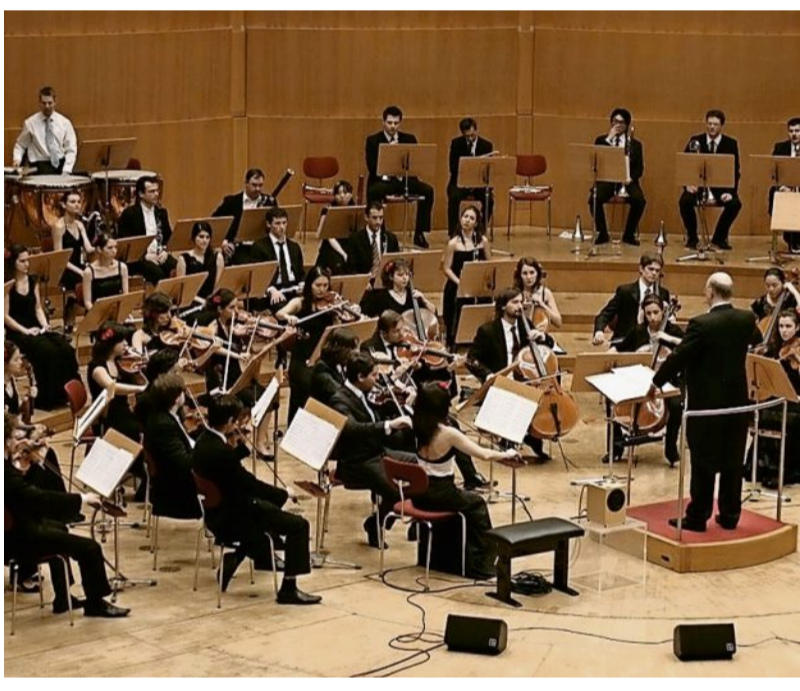
Am Freitag ab 19 Uhr auf der Seebühne: die Junge Philharmonie Köln.

„Alles klar auf der Andrea Doria“, „Honky Tonky Show“, aber auch aktuelleren Songs wie „Ich mach' mein Ding“. Es war ein sehr gelungenes Konzert, und das wiederum macht Appetit auf die folgenden Veranstaltungen des Kultursommers, für die es auch noch Karten gibt.