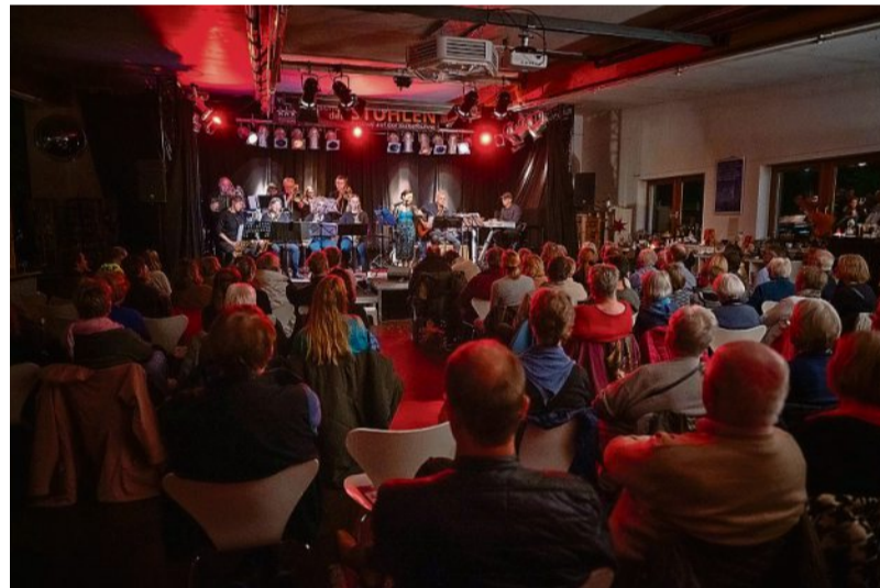
Einen Abend als musikalische Reise nach Buenos Aires erlebte das Publikum vor der „Kulturbühne“.