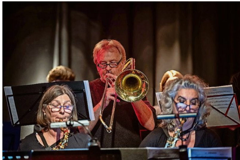
Die Bigband „Fettes Blech“ der Kreismusikschule bestach auch auf dem ungewohnten Terrain des Tango.